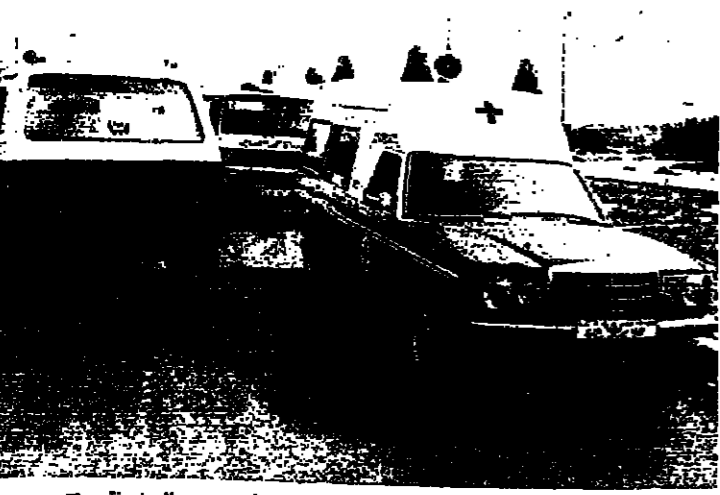
سيارات للصليب الاحمر تنتظر لنقل الجرحى